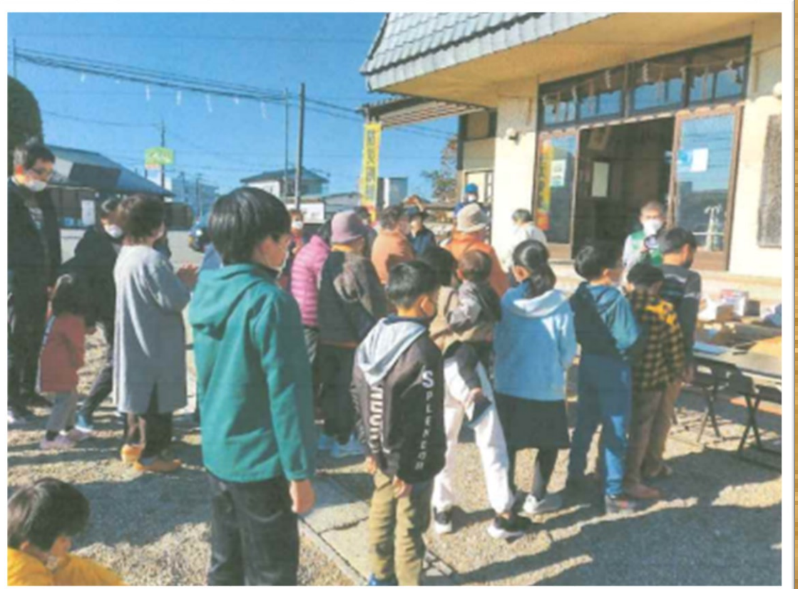
清水町二丁目自主防災会による 避難訓練の様子

※11月6日（日）に防災訓練を行った自主防災組織で補助金申請がまだお済みではない組織がございましたら危機対策課までご相談ください。