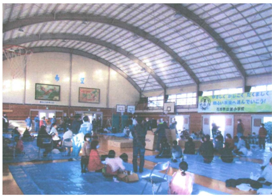
上大二町内会自主防災会による 避難所開設訓練の様子