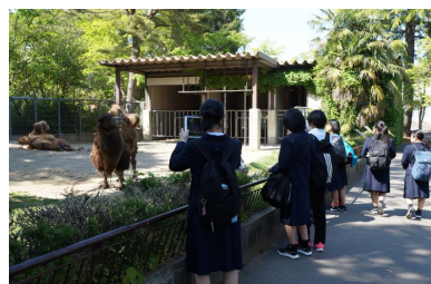
〈八木山動物公園研修〉

1日目は、班別自主研修として、高校や大学、専門学校等の訪問研修を行いました。スムーズにいくだろうと思いきや、地図を見ながら自分たちの足で目的地にたどり着くことができず、迷って迷って予約時間に間に合わない班が続出……。車