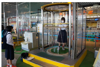
〈仙台市科学館研修〉

出発前日の結団式で、校長から次のような話をしました。「家族旅行は自由な部分が多いが、学校で行う宿泊研修はルールがあったり時間の制限があったりして、窮屈だ。でも、家族旅行では得られないものがある。それは仲間との思い出。だから、仲間とのよい思い出をたくさんつくってきてほしい。」また、「宿