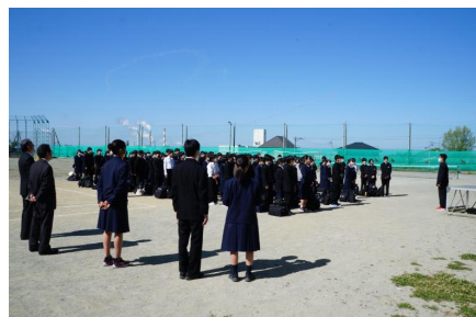
〈青天の中の出発式〉

泊研修は、場所と形を変えた授業のひとつだ。だから“楽しかった”だけではだめ。たった一つでいいから、この研修を通して得た“学び”を持ち帰ってきてほしい。」と話しました。