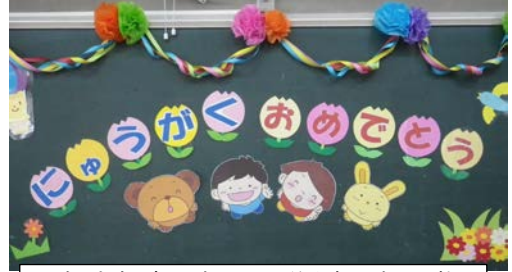
1年生教室黒板の入学を祝う掲示物

やわらかな春風と美しい花々に心華やぐ季節。いよいよ新年度がスタートしました。今年度も、新しい学年への期待を胸に登校してくる子供たちが、「夢と志をもち、粘り強く取り組む心太い子供」に育つよう、教職員一丸となり努力してまいります。地域や保護者の皆様にはこれまで同様の御理解、御協力を賜りますよう、よろしくお願い申し上げます。