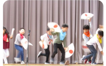
「令和2年度 学習発表会」

秋が深まり、朝夕の冷え込みが強くなってまいりました。各御家庭におかれましては、お子さんの体調管理をよろしくお願いいたします。