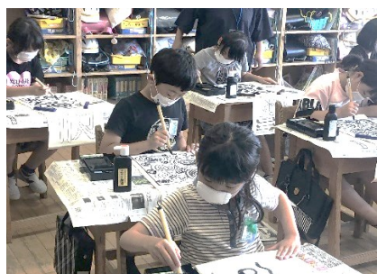
初めての習字・3年(17日)