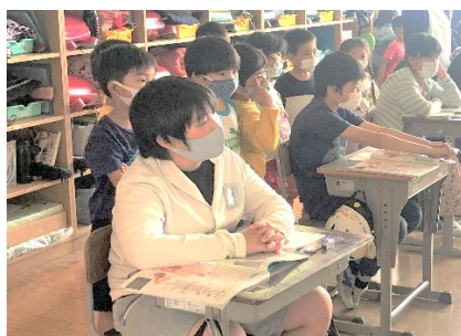
学校たんけん・1年(24日)