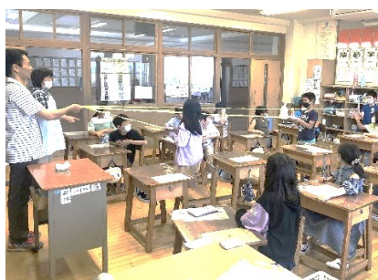
コロナを知ろう・4年(10日)