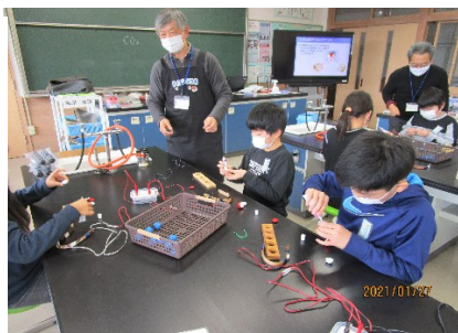
切った原子同士をつなげています