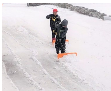
道具の扱い方も慣れていきます

今年は昨年に比べ雪の降る日が多いため、朝は子供たちが歩くところを教職員が雪かきしています。