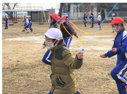
音楽に乗って跳びます