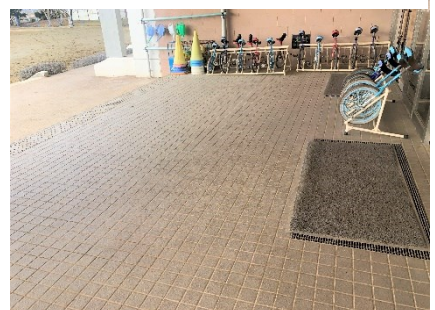
子供たちが教室に戻った後の昇降口

今日は、5年生対象の薬物乱用防止教室と「6年生を送る会」に向けた代表委員会がありました。この紙面に掲載することには間に合いませんでしたので、学校のホームページでお知らせいたします。不定期ですが、更新しておりますので、どうぞご覧ください。(今年度の学校だよりも掲載しております。)