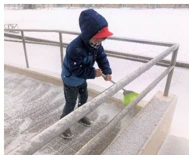
スロープはほうきで少しずつ

そんなある日、「お手伝いをしたい」と雪かきを手伝ってくれた子供たちがいました。きっとおうちでも雪かきのお手伝いをしているのでしょうね。とっても助かりました。