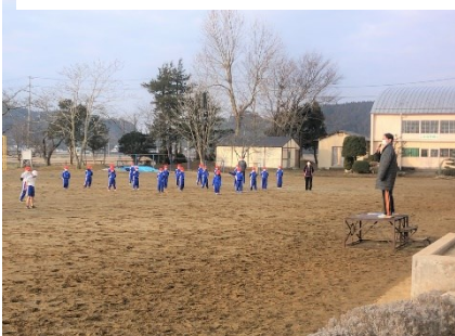
やっとできますね

そして、前小の子供たちの良いところが、朝の練習が終わった後の昇降口に表れていました。校庭で練習したため、靴底には湿った土が付いています。担任が声を掛けると、どの子もマットの上でしっかり土を落として昇降口を歩いていきました。おかげで昇降口や通路が土で大きく汚れることはありませんでした。みんなが良い気持ちで過ごせる行動を、これからも続けていけるようにしていきたいものです。