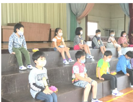
最初は少し緊張気味の1年生