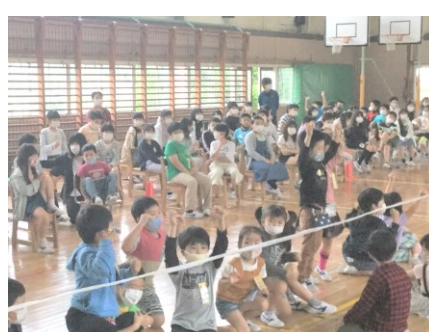
○×ゲーム。何問あたったかな？