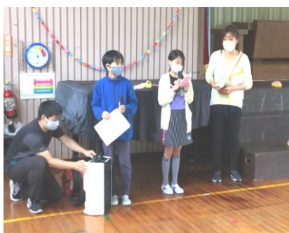
計画委員会 司会の準備は整いました

既に休み時間には、上級生のお兄さん・お姉さんが1年生教室やホール、校庭で一緒に遊んでくれています。それでも、全校児童で1年生を拍手で迎えたときの温かな雰囲気は、また格別でした。一緒にゲームをしたかった上級生もソーシャルディスタンスを取って、1年生のゲームを見守っていました。まだまだ我慢しなくてはいけないことが続く日々ですが、今できる予防対策を十分取った上で、子供たちの笑顔が見られる活動を行っていければと感じたひとときでした。