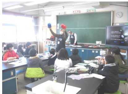
1/17 サイエンスラボ教室(4年)

感染の状況を見ながら、「今のうちにはできることは何だろう」「どんなふうにしたらできるだろう」と先生たちは相談しながら、準備しています。子供たちも、「新しい学校生活」の約束を守りながら頑張っています。