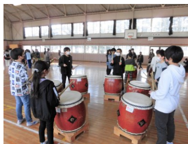
1/17 かさまつ太鼓練習(4~6年)