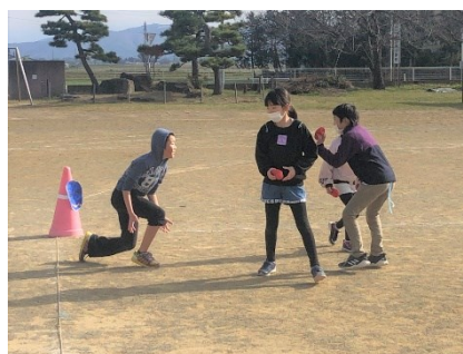
お化けおにごっこ