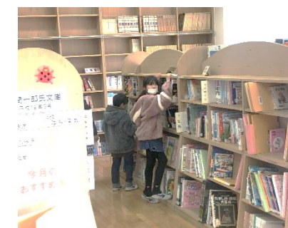
宝さがし 見つけた！

これから年末年始にかけて1年間の学習のまとめの時期ですが、職員一同、お子さんや保護者の皆様と共通理解を図りながら、教育活動に取り組んでまいりますので、引き続きご理解とご協力をよろしくお願ひいたします。