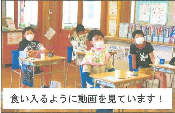
食い入るように動画を見ています！

歯みがき大会では、動画を見たり、ドリルを活用したりしながら「歯みがきをやりきる」方法を学びました。