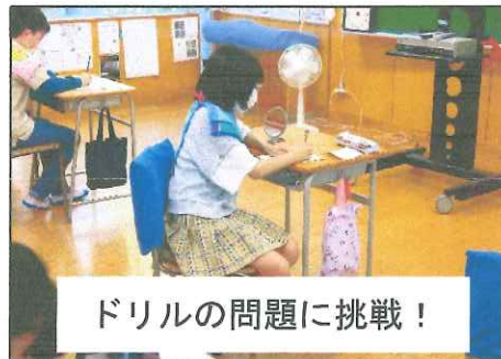
ドリルの問題に挑戦！