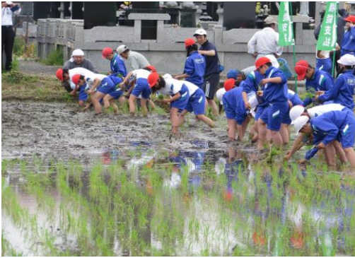
5年 田植え体験学習 (5/24)