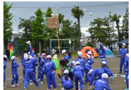
【天までとどけ2016】（1・2年）