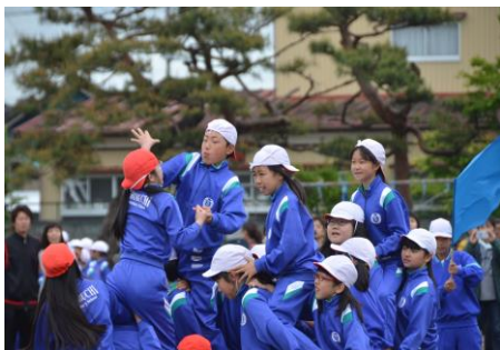
【一致団結！広瀨の陣】（5・6年）

当日は、早朝から、たくさんの保護者の方々、そして地域の方々にお越しいただき、子どもたちに温かい大きな声援をたくさん送っていただき本当にありがとうございました。運動会での子どもたち一人一人の頑張りをこれからの教育活動につなげていきたいと思ひます。これからもご理解ご協力をよろしくお願ひいたします。