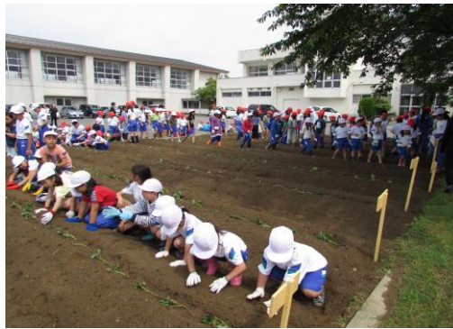
全校サツマイモ苗植え (5/27)

今年度も、自然保全会の方々と地域の方々のお手伝いをいただき、田植えの体験とサツマイモの苗植えを行いました。