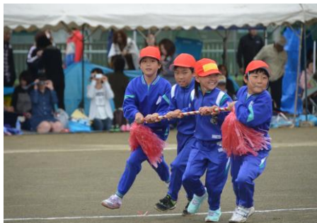
【巻き起こせ！広小ハリケーン】（3・4年）