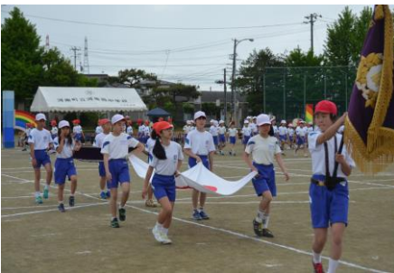
【校旗を先導に堂々の入場行進】

雨の影響で、残念ながら全ての種目を実施することができなかった今年度の運動会でしたが、どの学年の子どもたちも自分のめあてに向かって一生懸命に取り組み、一人一人の笑顔が輝く立派な運動会になりました。今年度は、赤組が優勝し三連覇を達成しました。赤組の子どもたちの笑顔と白組の子どもたちの残念そうな表情が印象的でした。来年は、四連覇そしてその阻止を互いに頑張ってください。