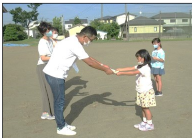
親子ふれあい標語表彰式

夏休みに募集した「親子ふれあい標語」。今年度のテーマは「言葉」です。審査の結果、優秀な作品として次の作品が選ばれました。