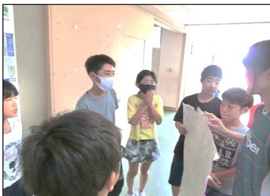
あいさつ運動の打合せをしています

全校児童が縦割り班にわかれて「あいさつ運動」を行っています。挨拶をするときのキーワードは「明るく」「元気に」「笑顔」です。広渕小の1日は、明るく元気な笑顔の挨拶から始まっています。先週は、元気な挨拶を目に見える形に表現しようと、枯れ木に花を咲かせる取り組みを行いました。元気な挨拶ができた子供たちに画用紙で作った花を渡します。それを次々に模造紙に貼っていったところ、一気に花が咲きました。それが上の写真です。昇降口ホールに掲示していますので学校へお立ち寄りの際は、ぜひご覧になってください。