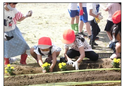
黄色のマリーゴールド