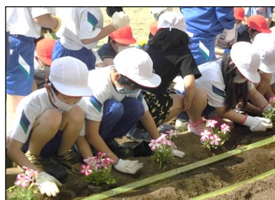
優しく丁寧に植えています！

6月4日（木）、校長室、職員室の前にある花壇に花の苗を植えました。毎日の水やりのおかげで、マリーゴールドの鮮やかな黄色やオレンジ、サルビアの燃えるような赤、トレニアのきれいな紫、濃いピンクと白が美しいペチュニア、そんな花たちが学校に彩を添えています。これからも委員会の子供たちを中心に世話をしていきたいと思います。