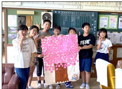
見事に咲いたあいさつの花

る取り組みを行いました。元気な挨拶ができた子供たちに画用紙で作った花を渡します。それを次々に模造紙に貼っていったところ、一気に花が咲きました。それが上の写真です。昇降口ホールに掲示していますので学校へお立ち寄りの際は、ぜひご覧になってください。