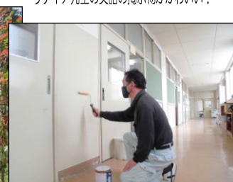
教室の壁を補修しています