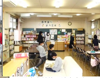
図書室開放で読書充実!