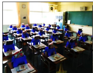
課題を渡す準備完了!