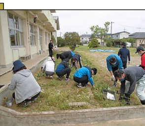
きれいな学校に! 花壇の整備