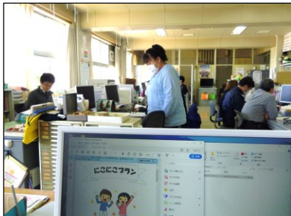
各担当の計画案をプレゼン