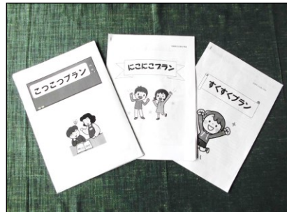
アクションプランが子供たちのもとへ!