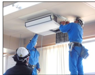
エアコンの設置が順調に進んでいます