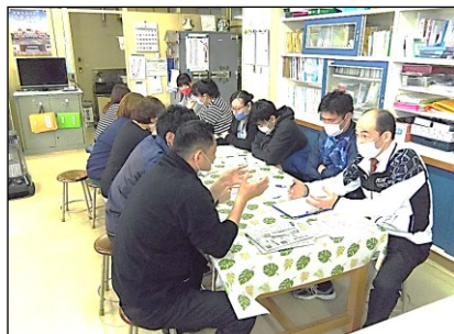
臨時休業中のアクションプランを計画中

子供たちが少しでもめあてをもって家庭生活を送ることができるよう、 広渕小臨時休業版アクションプラン を考えました。こつこつプラン(学習)、にこにこプラン(生活)、すくすくプラン(健康、体力向上)の3つに班に分かれ、職員が知恵を出し合いました。