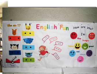
リディア先生の英語の掲示物がかわいい!