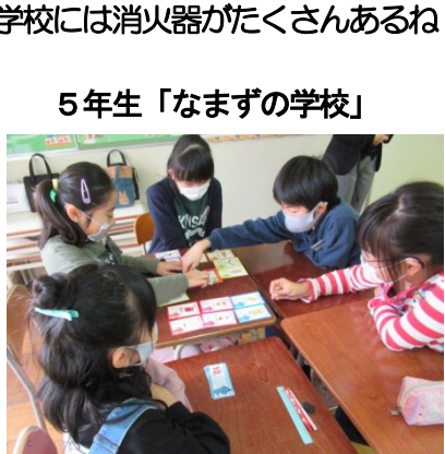
何を使って救助したらいいの？