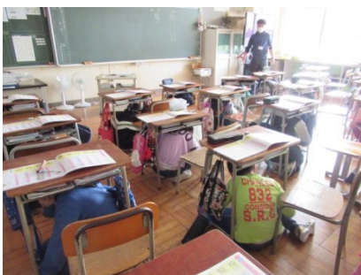
1年生「ぼうさいダック」