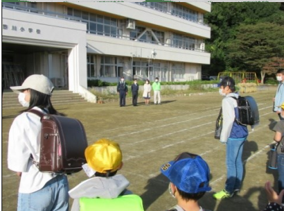
4名に協力いただきました