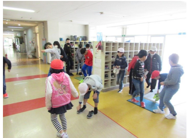
急いで、教室へ向かいます