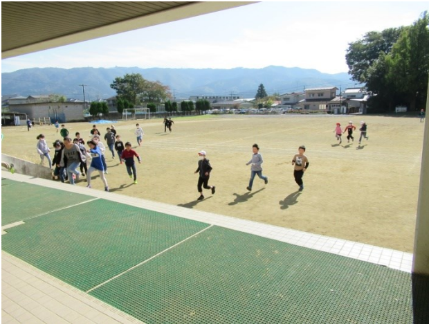
放送を聞き、校庭から屋内へ