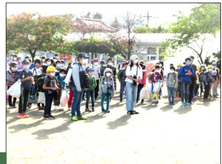
6年生が中心となって 地区毎に子供たちを並べます