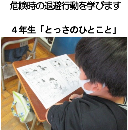
どんな言葉で伝えれば言えよいか