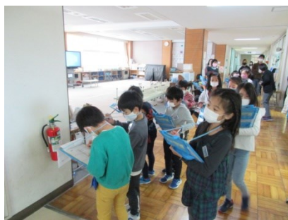
学校には消火器がたくさんあるね