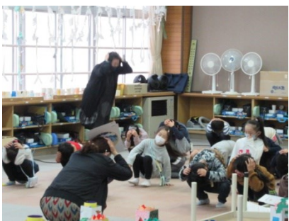
危険時の退避行動を学びます