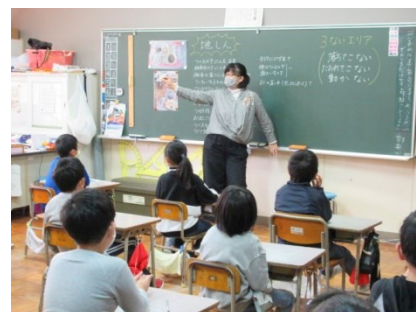
給食時に地震が起きたら…