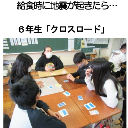
どうすればいいの、かなり悩むね！