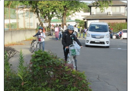
自転車通学の子供たちも 慎重な運転を心掛けます