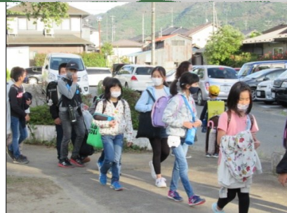
地区毎に集団下校します