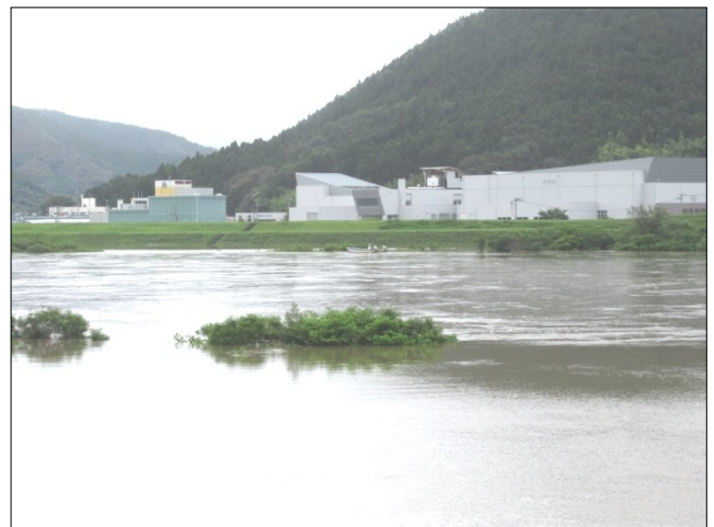
水かさが増しました