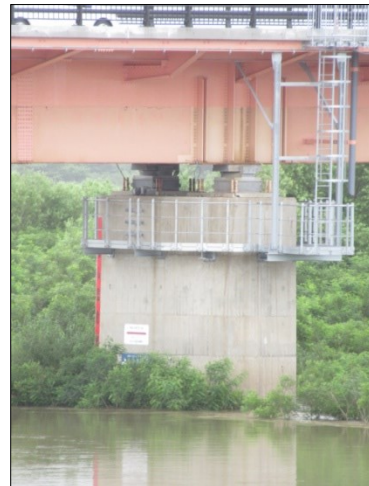
もうすこしで危険水位に達するところでした！