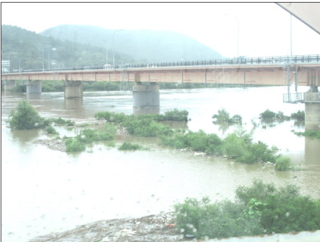
勢いを増した川の流れ