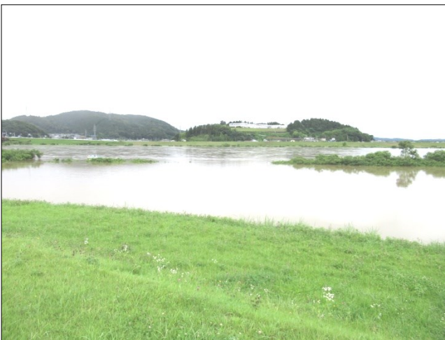
河川敷の駐車場が冠水