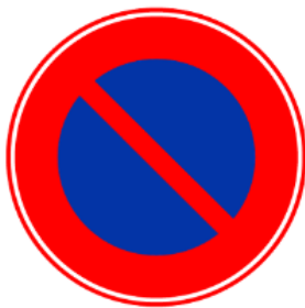
[ 駐車禁止 ]