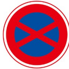
[ 駐停車禁止 ]