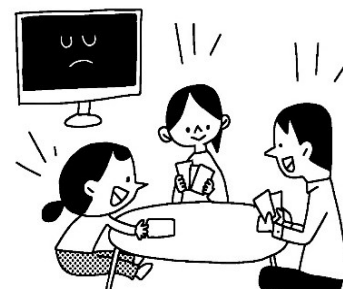
例3：週1回は、1日中テレビの電源をオフにする。