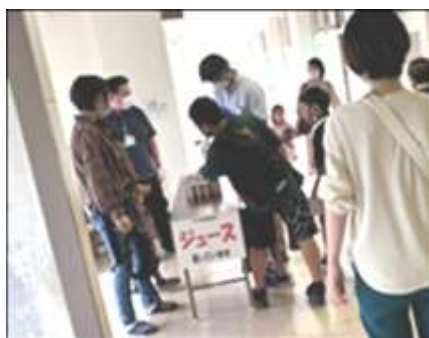
本部役員 ジュースを配りました