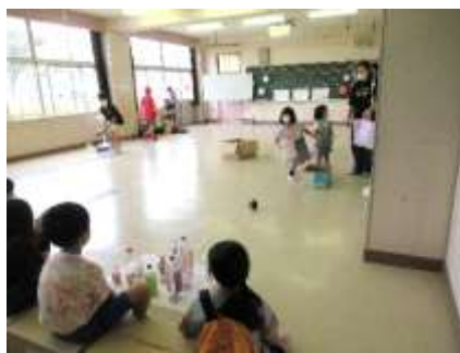
2学年PTA ペットボトルボーリング