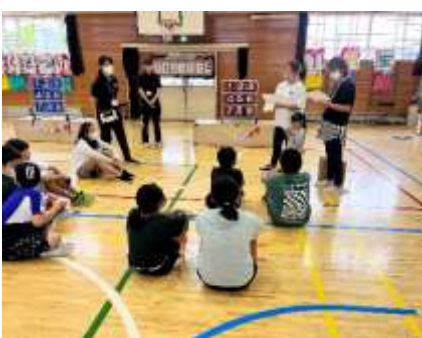
5・6年生は話をしっかり聞いてお手伝い