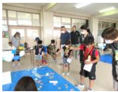
3学年PTA さかな釣りゲーム