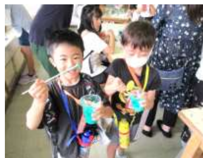
6学年PTA スライム作り