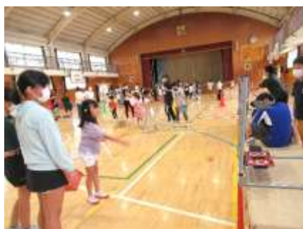
1学年PTA 的当てピンゴ

当日は暑さも心配されましたが、比較的過ごしやすい気温で、みんな元気に「開北まつり」を楽しむことができました。楽しむことを工夫した各学年のお店には、どこも歓声と笑顔があふれていました。これまで準備をしていただいた各学年PTAの皆さん、お店のお手伝いをしてくれた5・6年生の皆さん、ありがとうございました。