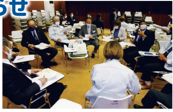
4月26日 最適化推進会議の様子