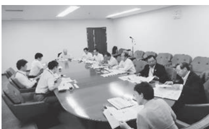
和歌山市役所にて担当者より説明を受ける

本市においても、少子高齢化等に伴う人口減少や経済のグローバル化、地域間競争の激化など地域経済を取り巻く環境は大変厳しいものとなっている。地域特性や産業構造等を考慮し、市民、事業者、行政が一体となつた産業の振興を図ることが重要であることから、和歌山市の取り組みは本市の事業推進に大いに参考となるものであった。