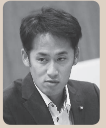
山口 莊一郎 議員