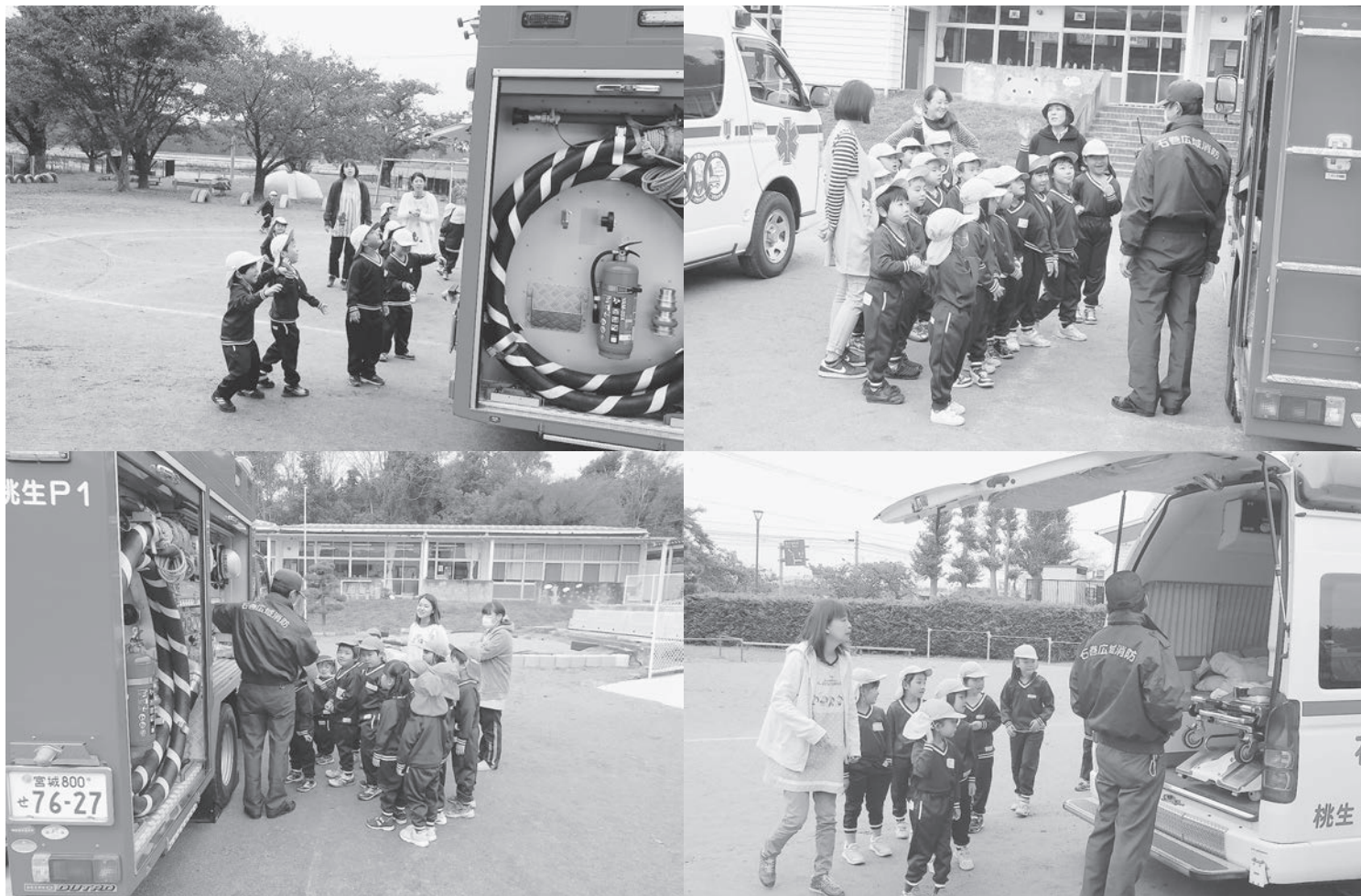
『桃生幼稚園のみなさん』