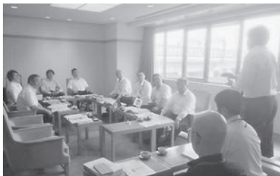
芦屋市役所にて担当者より説明を受ける

本市においても、134団地、7153戸の仮設住宅を建設し、4700戸の復興公営住宅を予定していることから、芦屋市の取り組みを参考にしながら、事業を推進していくよう、当局に提言していききたい。また、芦屋市では、平成10年復興住宅への入居完了時に生活保護世帯が約2倍になったことから、本市においてもなんらかの調査が必要ではないかと感じられた。