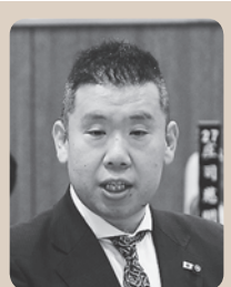
阿部 利基 議員