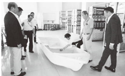
大府市 ボートの組み立ての様子

上並びに防災意識の高揚を図ることであり、緊急時は、市の災害対策本部の第2司令塔と位置付け、災害応急対策の拠点とすることである。