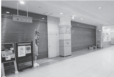
▲シャッターが降り、閑散とする市役所1階

答 市庁舎としての活用も考えている。また、駅前にあるべき総合観光案内所としての機能の必要性からも候補地のひとつである。いずれにせよ、来年の秋までにはオープンさせたい。