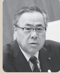
阿部 正敏 議員