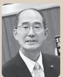
楯石 光弘 議員

雄勝地域が持っている特色を最大限生かした利活用のあり方を推進し、交流の拡大や雇用の創出につなげていけるよう、雄勝にあった有益な計画を検討する。