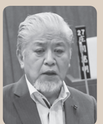
庄司 慈明 議員

答 利用状況は、平成29年8月末現在、石巻管内19件のうち、本市は9件。今後の利活用については、本市2件の申請が予定されている。引き続き、制度の周知に努めていく。