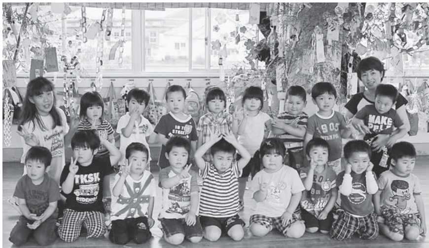
▼石巻地区保育所 たなぼた会の様子