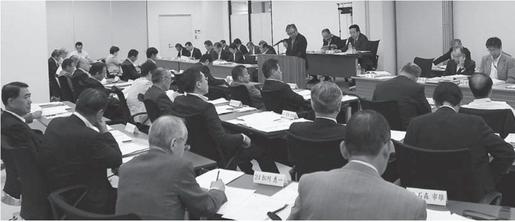
第2回定例会 本会議の様子

平成24年度第2回定例会は、6月7日から22日までの16日間の日程で開催されました。今定例会では、平成24年度石巻市一般会計補正予算をはじめ、各種会計補正予算や条例案など市長提出議案28件、委員会提出議案7件、計35件の議案が提出されました。審議の結果、いずれも原案のとおり可決されましたが、平成24年度石巻市一般会計補正予算(第1号)に対し附帯決議が出され、起立採決の結果、全会一致で可決されました。 また、委員会発議として提出された、石巻市議会議員定数条例については、起立採決の結果、賛成多数で原案可決となりました。