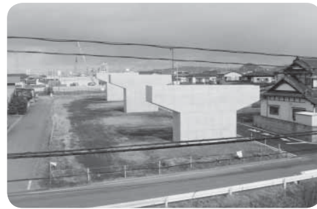
◀ 道路改良工事の進む石巻工業港曾波神線

このことから、関係機関との協議により、横断歩道、信号機の必要箇所への設置や各種交通安全施設の設置を図るなど、交通安全対策を講じていく。