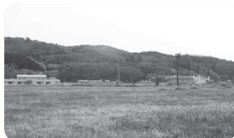
◀総合運動公園未整備地

陸上競技場整備については、現在の子定では合併11年目となる平成28年度の着工、平成32年度の完成となっている。合併10周年記念事業に位置付けが可能かどうか、今後庁内で協議していきたい。