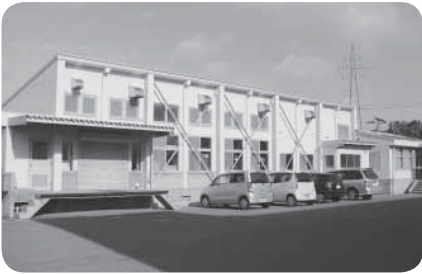
◀牡鹿給食センター

現在、共同調理場方式により6ヶ所の学校給食センターから、学校給食を提供しているが、このうち、旧市地区を対象とする住吉、湊、渡波学校給食センターの3施設と、牡鹿地区を対象とする牡鹿学校給食センターは、老朽化が進んでいるため、施設の更新が必要となっている。施設更新に併せ、これら施設の統廃合も検討しており、実施時期については、できるだけ早期の対応を目指す。