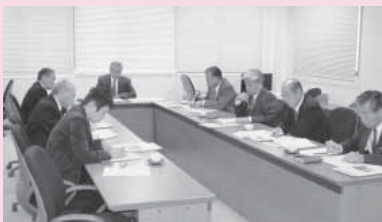
▲長崎市での視察の様子