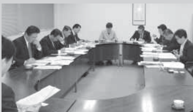
▲大牟田市での視察の様子

本市でも、産学官連携をより強固なものとし、地元企業への支援を図っていくべきと感じた。