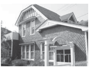
▲ 雄勝石ギャラリー

後継者育成に対する今後の行政支援等について、視組合側と協議を行うこととしている。