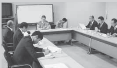
▲九州電力玄海原子力発電所見学