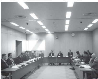
▶女川町との意見交換会の様子

また、平成22年11月24日（水）に女川町議会産業建設委員会と石巻市議会産業建設委員会の意見交換会が開催されました。当日は①牡鹿半島二ホンジカ対策の推進について、②市町間を結ぶ道路の整備促進について、活発な意見交換が行われました。