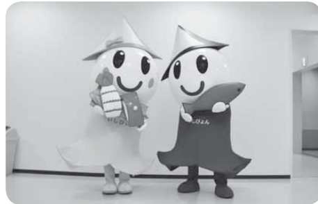
◀石巻観光キャラクター「いしびよんず」