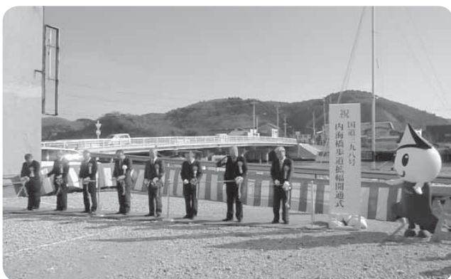
▲内海橋歩道橋拡幅開通式