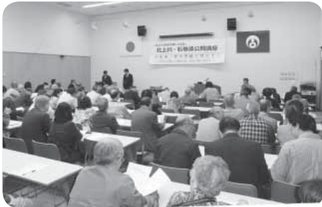
◀北上川・石巻湊公開講座の様子

答 来年度以降もpromナードの実現に向けて積極的に展開したいと考えている。整備に向けたハード対策として国・県の関係機関との弾力的な協議や勉強会の実施、沿川町内会との意見交換を、ソフト対策としては、今年から実施している北上川・石巻湊公開講座を継続するとともに、新たに水辺散策のルートマップや歴史案内サインの作成など、多くの市民に、水辺に関心を持ち気軽に参加できる機会を提供したい。