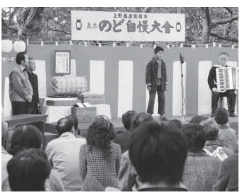
▲ 映画「エクレール・お菓子放浪記」撮影風景 (日和山公園)

完成した映画は、観光素材や教育素材として活用したいと考えており、映画製作会社等と調整したい。