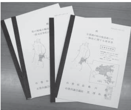
▲市の重要課題が盛り込まれた要望書

平成22年11月11日と12日、議長、副議長、4常任委員会の委員長及び市長等が上京し、市における重要課題の早期解決に向けて、次の事項の要望を行いました。