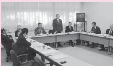
▲唐津市での視察の様子