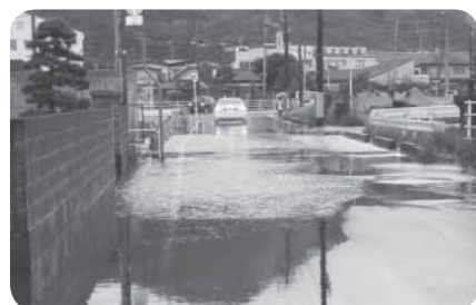
◀12.03の大雨による冠水の様子

答 冠水対策は喫緊の課題として捉えている。 高潮被害が発生している渡波地区2箇所と釜地区1箇所への排水ポンプの設置、また、北上地区の大沢川周辺での冠水対策を総合計画で位置付けしているため、対策の効果を検証の上、他の地区の冠水対策も順次進めていく。 国・県に対する要望をはじめとし、その解消に向けた取り組みを推進していく。