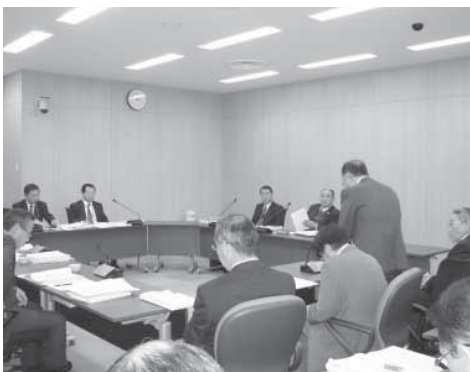
▲ 産業建設委員会での請願審査の様子

※この請願は、産業建設委員会の審査および本会議採決で採択され、関係機関へ意見書を提出することに決まりました。