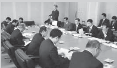
▲玄海町での視察の様子

古賀市では、阪神淡路大地震を受けて防災計画を作成していた。同市は全般的に災害が少ない地域で、福岡西方沖地震でも周辺自治体に比べ被害は少なかったとのことで、経験が少なかった分、何とかしなければという防災計画、体制への思いが感じられるものであった。