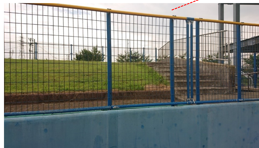
外野フェンス (ライト側)