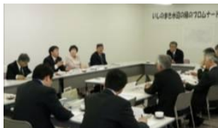
▲協議会風景イメージ 第1回プロムナード計画懇談会(平成22年5月開催)

プロムナード利活用促進協議会(仮称)を設立するなど、産、学、官、民が連携できる体制を確立し、利活用促進に向けた様々な取り組みを実施していく。