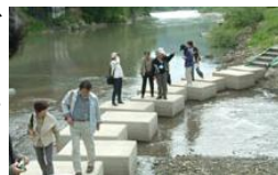
▲フットバスのイメージ(最上川 長井)

来訪者へのPRとプロムナード利活用の利便性向上を図るため、プロムナードを紹介した観光パンフレット、マップを発行する。