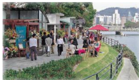
▲広島京橋川の事例写真

平成23年度の河川敷地の占用に関する規制緩和を活用し、民間事業者による河川敷地でのイベント施設やオープンカフェを設置し、水辺空間の賑わいを創出する。