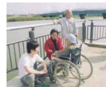
▲水辺のバリアフリーのイメージ

プロムナード計画に基づき整備するところにおいて、誰でも使いやすいバリアフリー化を図る。また、レンタサイクルを導入し、プロムナードのサイクリング利用を推進する。