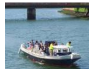
▲水上交通のイメージ

昔の石巻港の歴史・文化を感じながら、来訪者の回遊、移動の足となる舟運を復活させる。