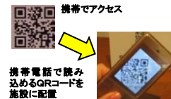
▲携帯でアクセス 携帯で読み込めるQRコードを施設に配置

インターネットホームページを立ち上げ、各種情報発信を行うとともに、モバイル向けの情報提供を行う。