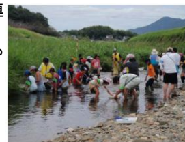
▲水生生物調査風景

小中学校と行政、市民が連携して、石巻の特性を活かした教材による環境教育や防災教育を推進する。