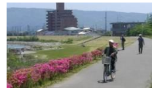
▲サイクリングでの水辺散策