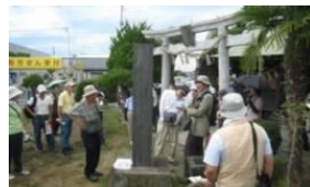
▲第8回北上川石巻湊古公開講座にて、船魂神社を探訪

石巻の歴史文化に詳しい石巻マスターを発掘し、ボランティアガイド等の育成を長期的な事業として行う。