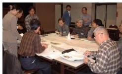
▲ワークショップのイメージ

サインプロジェクト(仮称)は、市民、行政、学識経験者など「いしのまき水と緑のプロムナード計画」に係る人たちの連携と協働により、サインの検討から設置を行う。また、設置後のサインの更新や充実を図る活動を将来にわたり継続的に行う、市民参加型のプロジェクトとする。