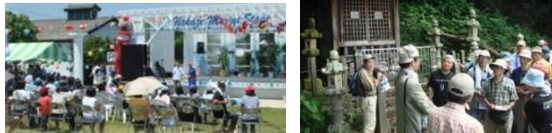
▲イベント事例写真(海軍公園でのイベント風景) ▲観光ツアーイメージ (北上川石巻湊公開講座による歴史探訪)

プロムナードの各拠点やルートの特徴を活かしたツアーをNPOやボランティア、大学などとの連携により企画、ツアーの実施を重ねることにより、より市民や観光客に満足いただけるものにレベルを高めていく。また水辺や川と親しむ各種イベントを開催し、来訪者の増大を図る。