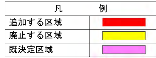
石巻広域都市計画道路の変更 計画図(1)