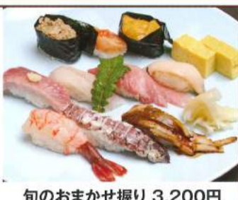
旬のおまかせ握り 3,200円