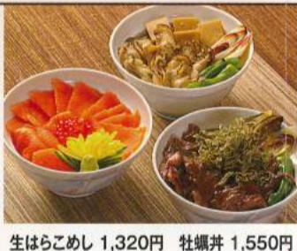
生はらこめし 1,320円 牡蠣丼 1,550円