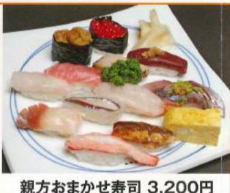
親方おまかせ寿司 3,200円