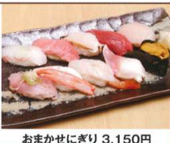
おまかせにぎり 3,150円