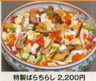
特製ばらちらし 2,200円