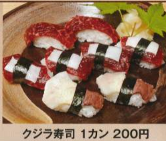
クジラ寿司 1カン 200円