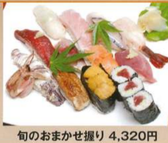
旬のおまかせ握り 4,320円