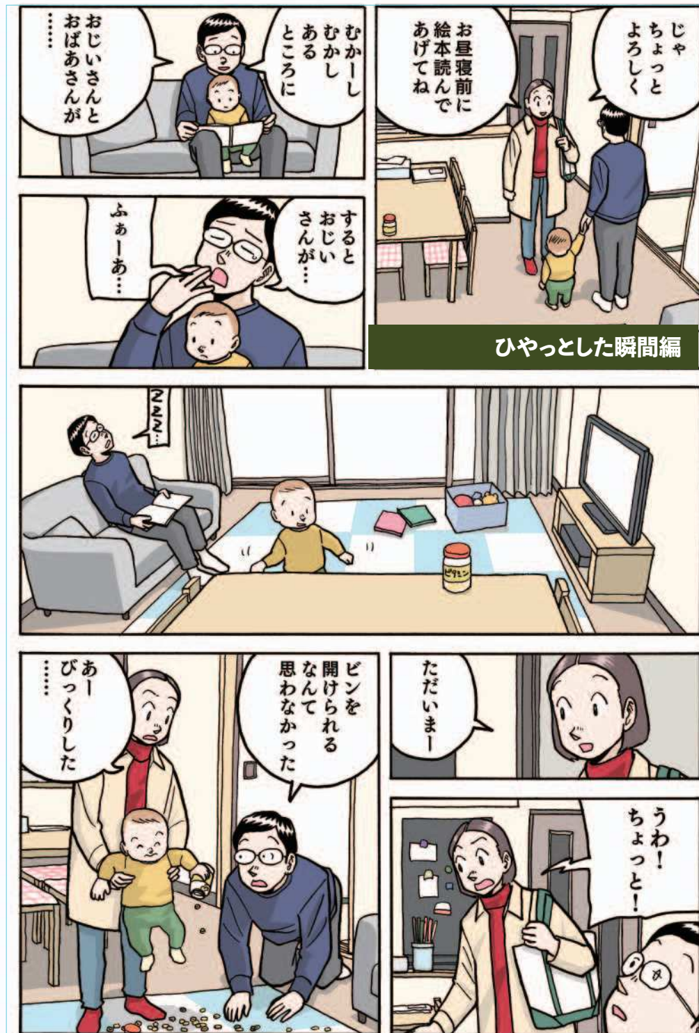
ひやっとした瞬間編