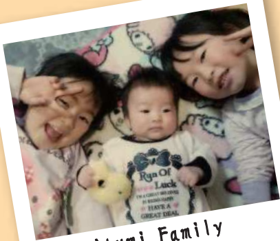
Atumi Family (6才・4才・0才)

① ママが手を離せないときはパパが動くので、はっきり分担していません。パパ→(朝)子どもたちの身支度、ゴミ出し(休日)夕飯の準備、子どもとお風呂にはいる