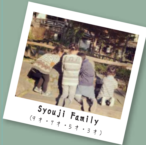
Syouji Family (9才・7才・5才・3才)

① 基本、役割分担はありません。パパ→(休日)凝った男前料理、子どもたちと遠出してママに1人の時間。こそぞという大事な時叱り役。 静かに力強く語りかけるような叱り方は子ども達に効果抜群。