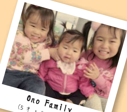
Ono Family (5才・3才・1才)