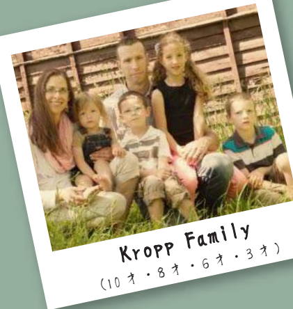
Kropp Family (10才・8才・6才・3才)

⑥ 子育ては山あり谷あり、正解もゴールもありませんが、しっかりと愛情を注いであげればおのずと子育ては成功に向かうのでは？と自分もそうじて今育児をしています。 一緒にがんばりましょう！