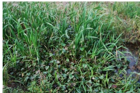
ヒメガマ・ミズアオイ