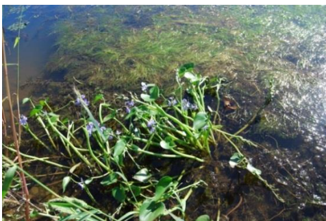
抽水（ミズアオイ）・沈水（イトモ）群落

出現植物は全部で14種です。沈水植物は、ホザキノフサモ、イトモ（希少種）、エビモ、トリゲモ（希少種）、ミズオオバコ（希少種）の5種です。浮漂植物のウキクサ、浮葉植物のヒシ、抽水植物はミクリ（希少種）、ヒメガマ、クログワイ、サンカクイ、ミズアオイ（希少種）、ヨシ、セリの7種です。