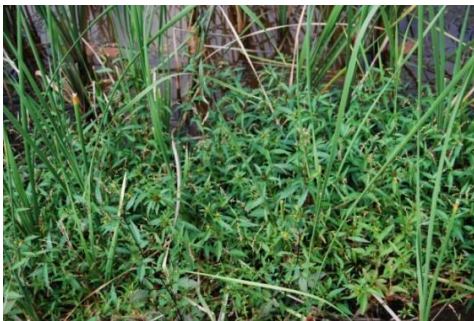
ヒメガマ・ヤナギタデ

出現種数は20種（浮漂植物ウキクサ1種を含む）、全て在来種です。希少種はミズアオイ、ミクリの2種です。