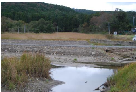
牡鹿半島十八成浜

今回の調査では、この地域の特性を示す群落や希少種とされる植物は確認されず、2011年の大津波の植生への影響は、現在はほとんど残っていません。