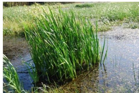
沈水植物・抽水植物（ミクリ）群落