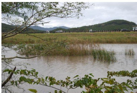
ヨシ抽水群落とヒメガマ抽水群落

オニグルミは下流部の堤防法面にオニグルミ・アズマネザサ群落を形成しているほか、河川敷や川岸にも生育しますが、若木が大部分であり、上流では津波の影響とみられる成木の枯損が目立ちます。草原群落は、ヨシ群落（低水敷）が最も発達しています。増水期には抽水群落状になる部分が広く、種組成は単純です。川岸でもヨシ群落が最も広い面積を占め、オギ群落はわずかです。ヨシ群落以外の抽水群落ではヒメガマ群落とマコモ群落がみられますが、ともに面積は小さく種組成は単純です。