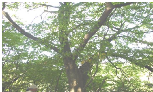
牧山のイヌブナ (牧山市民の森)