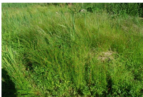
イグサ・ヒメガマ・タコノアシ

ヒメガマなどは湿地の植物の中では、より水湿の環境に群落をつくるのが普通です。これらの植物が目立つ東部の湿地と比べると、西部の湿地はやや乾いた環境にあると考えられます。さらに、西側にはケハンノキ群落があることから、この湿地は西側から陸地化が進んでいるということが分かりました。微妙な環境の変化に対応した植生の姿を見ることが出来る点では、数少ないすぐれた後背湿地であるといえます。