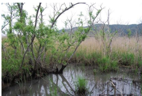
オオタチヤナギ・ヨシ群落

ヨシ群落、マコモ群落、ヒメガマ群落を主にした抽水植物群落だけで、その他の浮葉植物群落や沈水植物群落などは全く確認されませんでした。単独ではヒシ、ウキクサが観察されました。