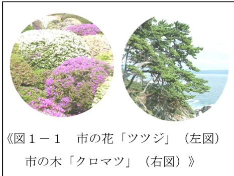
《図1-1 市の花「ツツジ」(左図) 市の木「クロマツ」(右図)》

平成17年4月1日、石巻地域の1市6町は合併により、新たな石巻市として生まれ変わりました。本市は、東経141°、北緯38°に位置し、東西約35キロメートル、南北40キロメートル、面積554.55平方キロメートルの市域の中に、東部に北上山地と牡鹿半島の山々や丘陵が連なるとともに、太平洋に面してリアス式海岸が形成され、中央部や西部の平野部には田園地帯が広がっています。また、追波湾に注ぐ北上川と石巻湾に注ぐ旧北上川が流れ、流域には肥沃な穀倉地帯が形成されています。このように、本市は変化に富んだ地形を有しており、山、川、海という多様な生態系がそろうています。