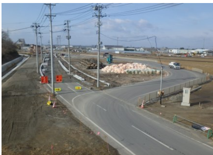
▲区画道路築造工事状況