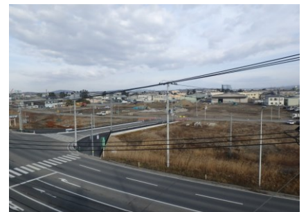
▲取付道路完成状況