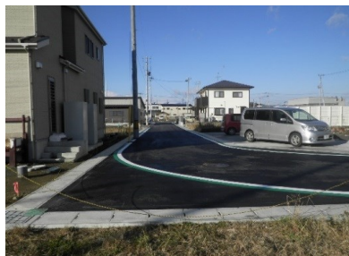
▲道路舗装敷設完了