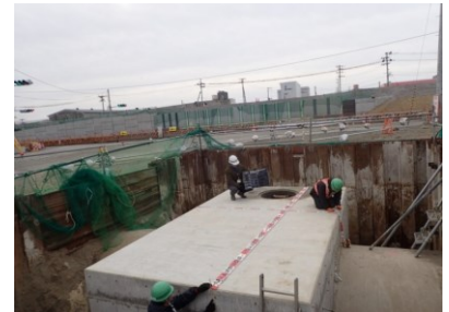
▲割込み（雨水φ2800mm）特殊人孔築造完了