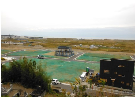
▲地区西側 宅地整地状況①