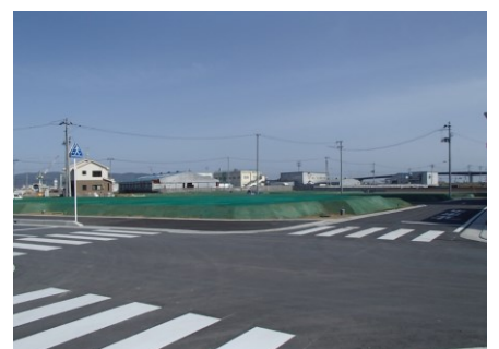
▲地区東側 宅地整地状況