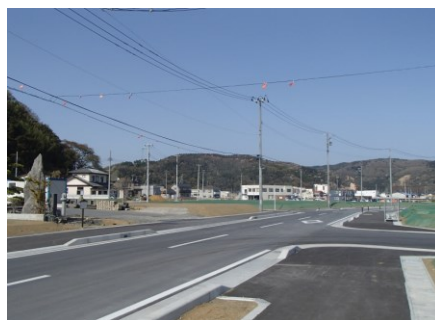
▲地区東側 区画道路築造状況②