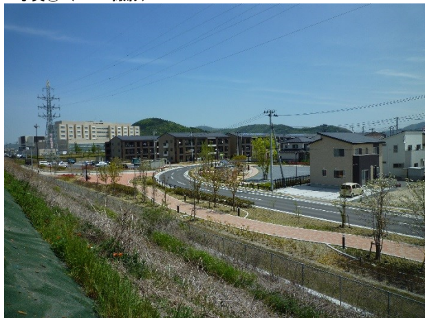
写真① (H29. 4撮影)