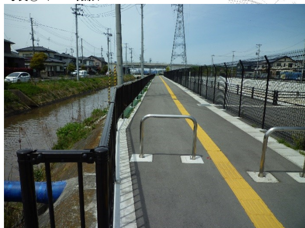
写真③ (H29. 4撮影)