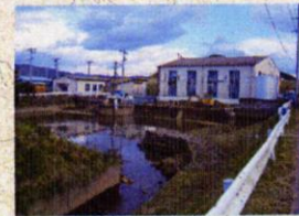
後谷地第1、第2排水機場