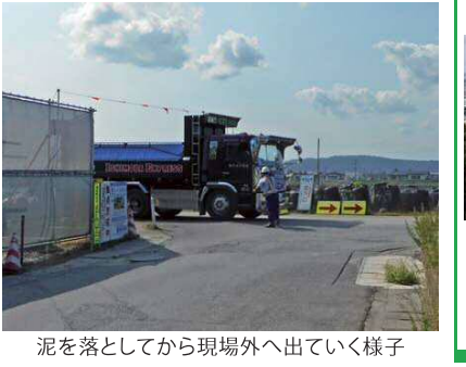
泥を落としてから現場外へ出ていく様子