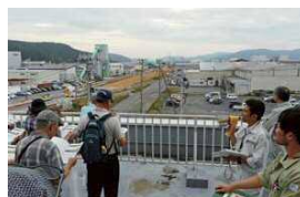
石巻東部浄化センター3Fペランダから門脇流留線を見学