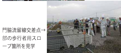
門脇流留線交差点→部の歩行者用スロースペースを見学

2017 リバイブいしのまき 復興工事の今を見てみよう! 【日時】8月20日(日) 午前10時~午後3時 【場所】中瀬公園(石ノ森美術館前) 【イベント内容】 ○働く車に乗ってみよう! ダンブトラック ミニバックホー パトローカー ○ペーパークラフトで働く車を作ってみよう! パワーショベル 道路パトローカー 排水ポンプ車 ○VRで旧北上川の現在・未来を見てみよう! ○パネル展示(復興事業の様子など) 主催:石巻市市街地復興工事調整会議 後援:宮城県建設業協会石巻支部 問い合わせ先:石巻市基盤整備課 0225-95-1111(内線5517・5518)