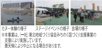
カヌー体験の様子 ステージイベントの様子 会場の様子 ※本事業は、(一社)東北地域づくり協会みちのくに国づくり支援事業の支援により実施しています。 悪天候により中止になる場合があります。

北上川フェア2017 ~もっと知ろう!楽しもう!北上川~ 【日時】8月20日(日) 午前10時~午後3時 【場所】中瀬公園(集いの広場ほか) 【イベント内容】 ○各種ステージイベント(楽楽演奏、踊り、クイズ大会など) ○川辺でバーベキュー ○パネル展示(北上川の歴史・役割について、復旧・復興事業についてなど) ○川辺Cafe ○川をキレイにするどろ団子作り体験 ○かわまち散歩 ○旧北上川船下り体験・旧北上川河口口クルーズ ○カヌー体験教室・カヌーレース ○飲食ブース・フリーマーケットブース 主催:北上川フェア実行委員会 後援:石巻がほく、石巻日日新聞社、ラジオ石巻FM76.4 問い合わせ先:事務局(石巻市河川港湾室内) 0225-95-1111(内線5608・5609)