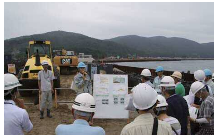
渡波防潮堤の盛土に上り見学

〈参加者の皆さまの声〉 ○観光だけではなく、このような見学会も大切だと思った。 ○国、県、市がガッチリとスクラムを組まれてこのように(復興事業が)進んでいくのだと実感した。 ○女川方面から車で通ると堤防や高瀬土のため、周りが何も見えなかったのが、今回見学会に来てとてもよかった。 ○今回の見学会で復興の様子の一部を知ることができ、工事の大変さや多くの人々の応援で成り立っていることを知ることができた。 ○まだまだ支援が必要と感じた。