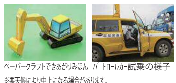
ペーパークラフトできあがりみほん パトローカー試乗の様子 ※悪天候により中止になる場合があります。

2017 リバイブいしのまき 復興工事の今を見てみよう! 【日時】8月20日(日) 午前10時~午後3時 【場所】中瀬公園(石ノ森美術館前) 【イベント内容】 ○働く車に乗ってみよう! ダンブトラック ミニバックホー パトローカー ○ペーパークラフトで働く車を作ってみよう! パワーショベル 道路パトローカー 排水ポンプ車 ○VRで旧北上川の現在・未来を見てみよう! ○パネル展示(復興事業の様子など) 主催:石巻市市街地復興工事調整会議 後援:宮城県建設業協会石巻支部 問い合わせ先:石巻市基盤整備課 0225-95-1111(内線5517・5518)