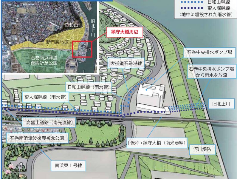
各種復興工事位置図

凡例 ..... 日和山幹線 ..... 聖人堀幹線 (地中に埋設された雨水管)