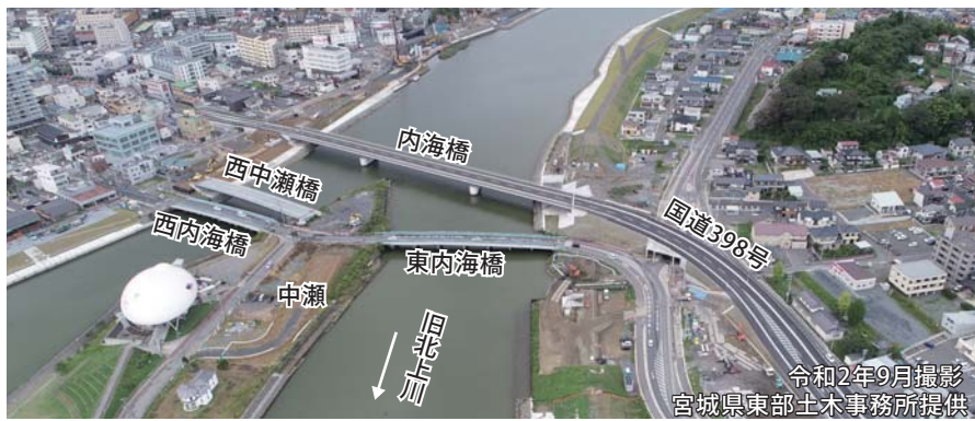
令和2年9月撮影 宮城県東部土木事務所提供