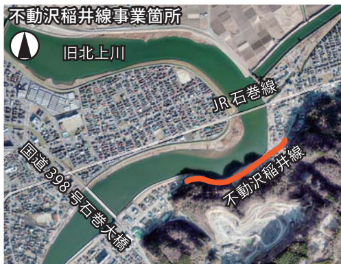
不動沢稲井線事業箇所

8月には、一部区間を山側に暫定的に切り替えました。引き続き、河川堤防と一体的に工事を進めています。