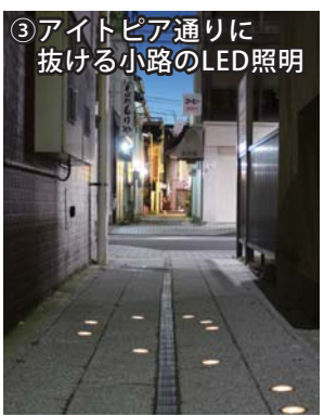
③アイトピア通りに抜ける小路のLED照明