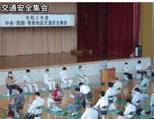
交通安全集会 令和2年度 中央・西部・東部地区交通安全集会