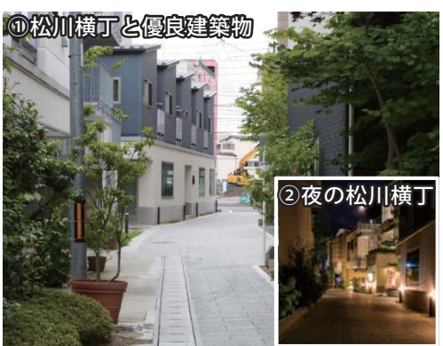
①松川横丁と優良建築物