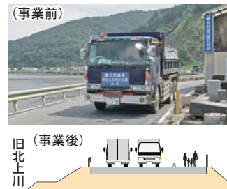
相互通行が円滑に。歩行者の通行が安全に。