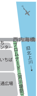
交流拠点周辺の小路