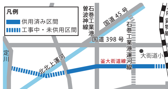
約3.6kmのうち、1.8kmが供用済み