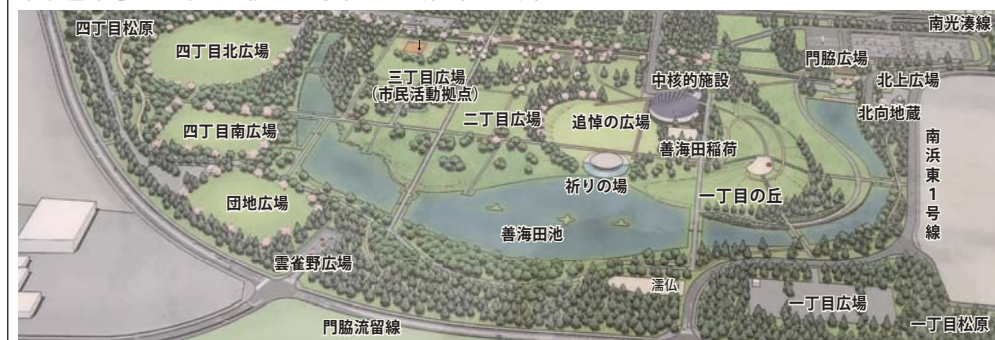
※图中的施設名称は仮称であり、正式名称ではありません