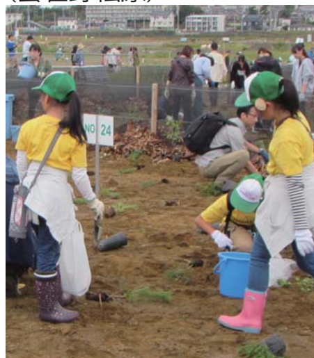
植栽樹種 クロマツ アキグミ カシワほか (全16種)