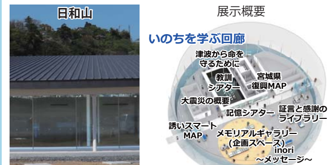
祈りの場から日和山を望む

屋根の傾きは、日和山と公園内の祈りの場が「つながり」を持つよう、視線を妨げない工夫をしています。また、施設から日和山を眺望できるように設計しています。