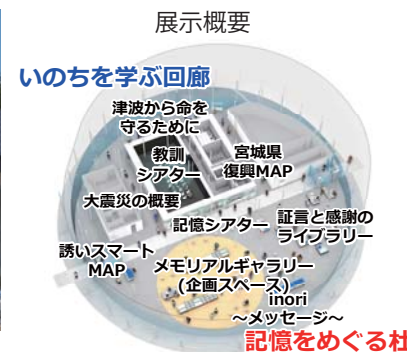
※内容は、変更の可能性があります。