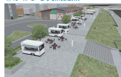
堤防一体空間イメージ