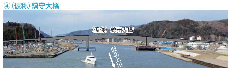
完成イメージ(日和大橋から望む)