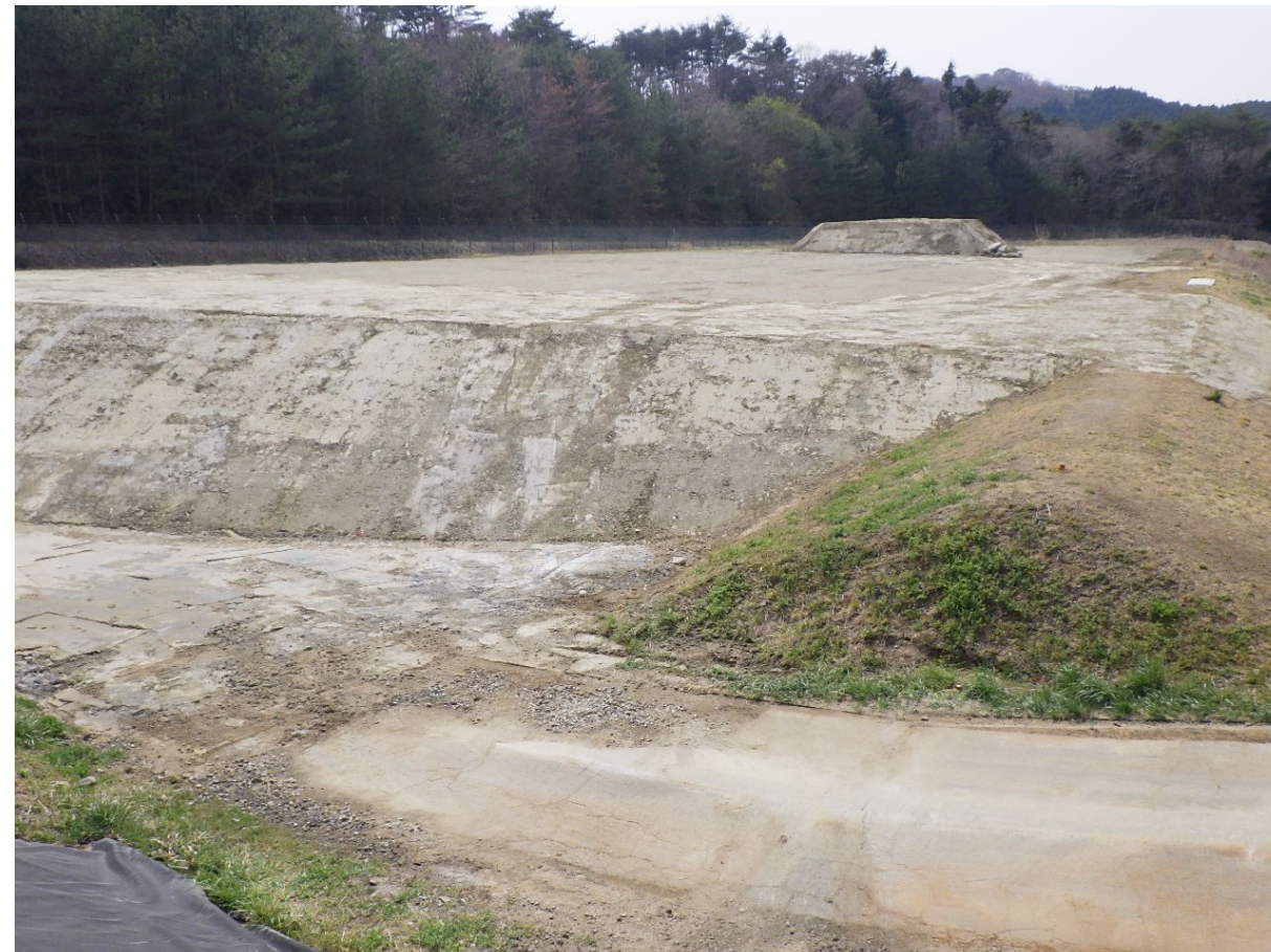
着 工 後