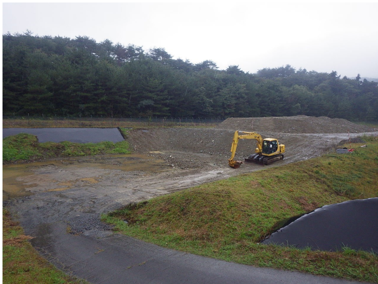
着 工 前