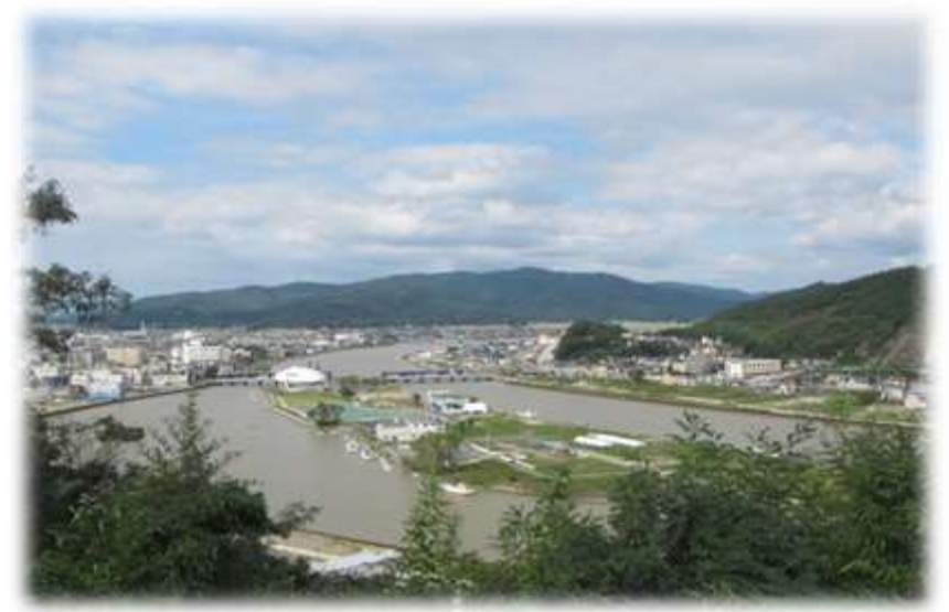
日和山から見た計画地 (平成27年9月16日撮影)