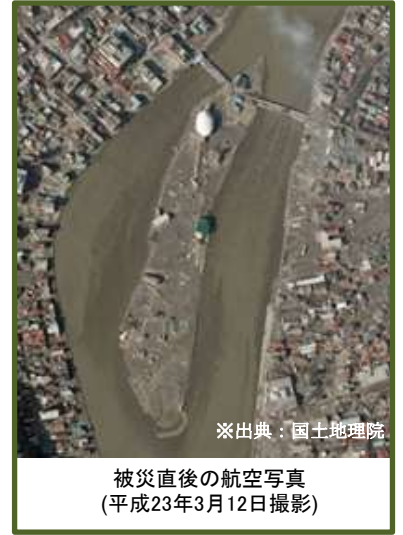
被災直後の航空写真 (平成23年3月12日撮影)