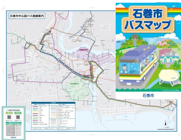
石巻市バスマップ（平成 26 年 3 月作成）