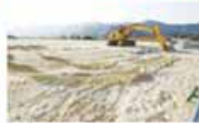
▲新渡波西土地区画整理事業地内に整備されます。完成目標年度は平成28年度です。