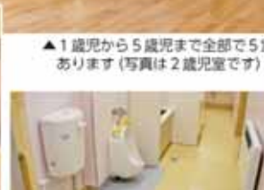
▲1歳児から5歳児まで全部で5室あります(写真は2歳児室です)