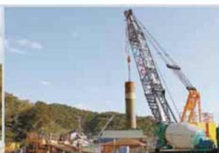
復興公営住宅建設 (吉野町) ⑥