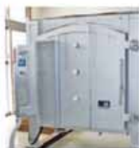
▲焼成室(3階)旧みなと荘から移設しました