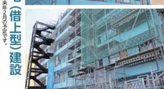
復興公営住宅(借上型)建設 外観が見えてきました。入居は来年2月の予定です。