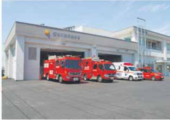
▲建物は、鉄筋コンクリート造2階建てです。

2 石巻消防署西分署 (百層町五丁目12-1) 蛇田地区の消防力強化を図るため、石巻消防署西分署が建設され、5月1日塗から運用を開始しました。