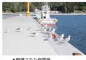
▲整備された物揚場