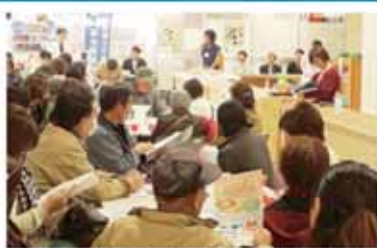
11月22日(土)市役所5階市民サロン前