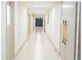
▲廊下や階段部分等、1階の共用部分が改修されました。