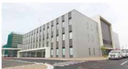
▲復興住宅近くにある石巻赤十字病院では、災害医療研修センターが5月16日(月)にオープンしました。