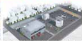
▲建物は、鉄筋コンクリート造2階建てとなります。ヘリポート等も整備されます。