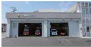
▲消防ポンプ車や救急車等の計3台が配備されます。今後は写真左の車庫のような水増付消防ポンプ車が配備される予定です。