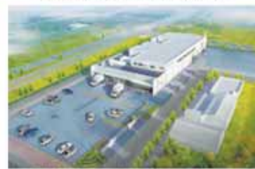
▲災害時には、炊き出しの拠点となる予定です。

東日本大震災で大きな被害を受けた湊、渡波両学校給食センターを統合して新設する「(仮称)石巻東学校給食センター」の整備が進められています。