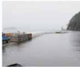
▲防波堤の整備が進められています。(8月撮影)