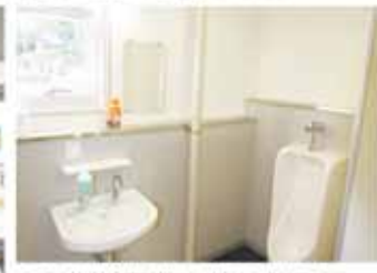
▲トイレは全面改修されました。換気扇も一新しました。

耐震補強工事と一部改修工事のため、昨年9月から休館となりましたが、工事が完了し、4月から一般利用が再開となりました。