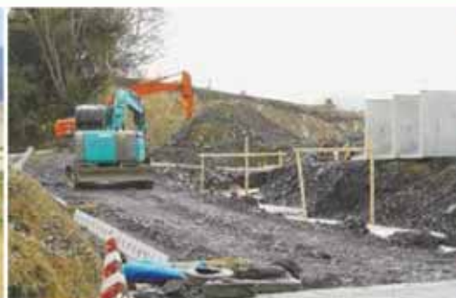
釜谷崎地区(駒の迫団地) 防災集団移転造成工事 ⑨