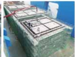
▲上の写真は、泊漁港で用いられるケーソンです。高さ9メートル、重さ約700トンの大きさです。(8月撮影)ケーソンは、フローティングドックという海上に浮かんだ設備で製作されます。(写真の青い部分がフローティングドック)製作が完了すると、ドック自体を沈ませて完成したケーソンを引き出します。