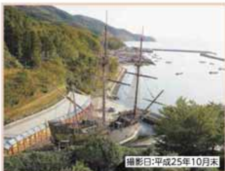
撮影日:平成25年10月末