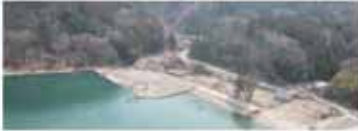
▲沈下した物揚場(平成23年3月撮影)