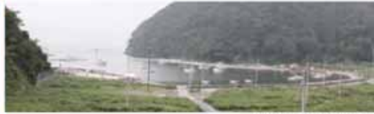
▲名振漁港全概(8月撮影)