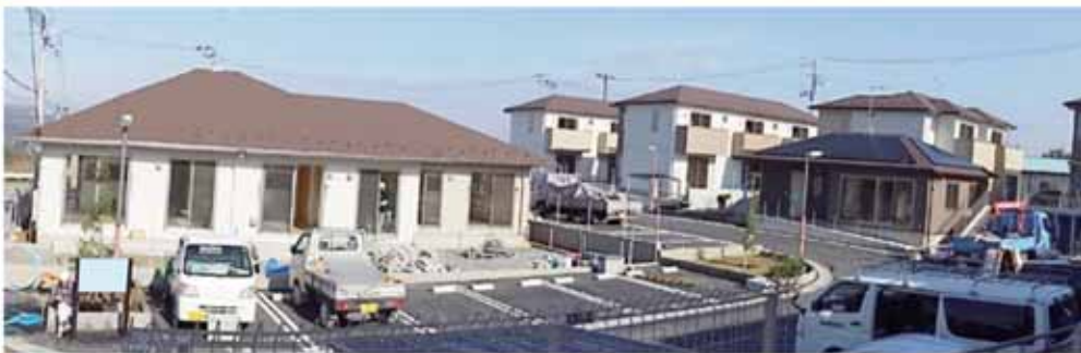
12月下旬の完成検査に向けて工事が大詰めを迎えています。入居予定者の見学会も行われました。(11月撮影)