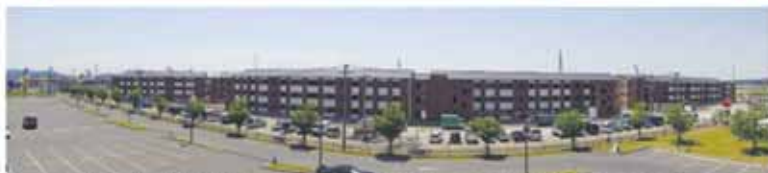
▲6月下旬の完成に向けて工事が進められています。6月6日(土)・7日(日)には入居予定者の見学会が行われました。