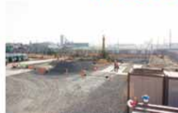
▲平成28年4月の稼働を目指しています。

東日本大震災で大きな被害を受けた湊、渡波両学校給食センターを統合して新設する「(仮称)石巻東学校給食センター」の整備が進められています。