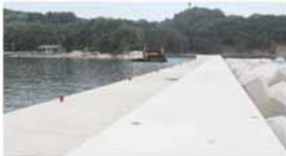
▲西防波堤 (被災状況写真A) は消波工を除きおむね完成しました。(8月撮影)

全機能が回復済みの漁港数 0港 一部機能が回復済みの漁港数 31港 被災した漁港数 34港 ※市管理漁港のみ計上