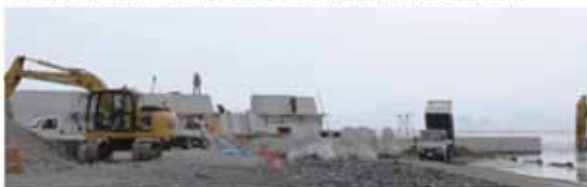
▲▼東防波堤 (被災状況写真B) は、現在、復旧工事が進められています。(上: 8月撮影 下: 9月撮影)

北上漁港 (相川地区) では、流失した東西の防波堤等の復旧工事が行われています。