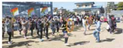
▲渡波小学校鼓笛隊による記念演奏会が行われました