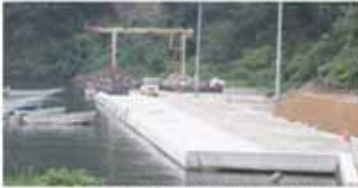
▲一部復旧工事が完了した物揚場(8月撮影)