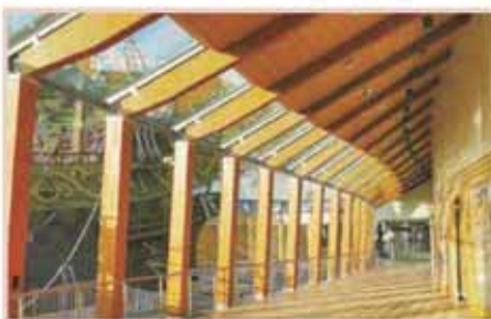
津波で被害を受けたサンファン館が修復され、再開館しました。