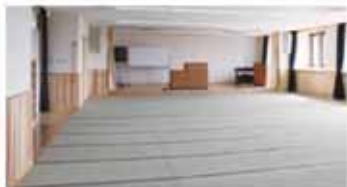
▲集会室(2階)は広さ183.15平方メートル、定員130人です

震災により大きな被害を受けたみなと荘は、新しい建物の2階・3階部分に開設されました。また、2階には、子育て支援室や放課後児童クラブ、高齢者ボランティア交流室も設置されています。