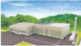
▲建物は、鉄筋コンクリート造1階建てとなります。