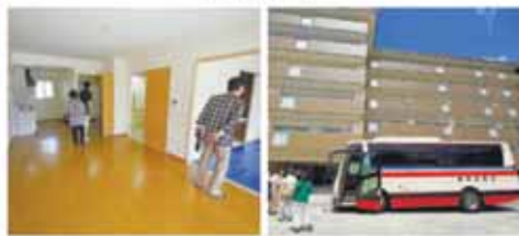
▲現地見学会の様子