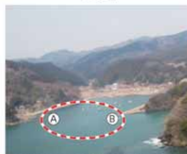
▲被災状況 (平成23年3月撮影) 防波堤が流失しました。