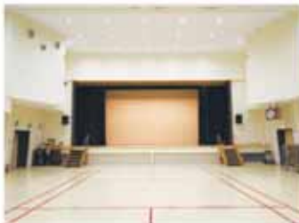
▲大ホールのステージは、木床が改修されました。