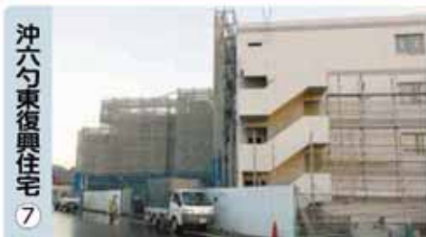
沖六勺東復興住宅 ⑦