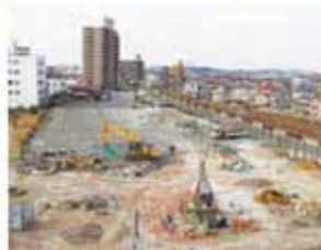
▲昨年10月に建設工事の安全祈願祭が行われ、工事が始まりました。(昨年11月撮影)