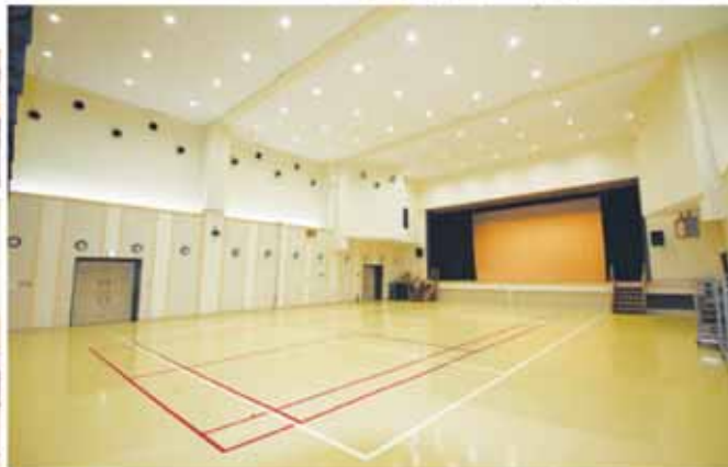
▲大ホールは、床や壁等が改修されました。天井の照明はLEDを採用しています。