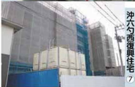
沖六勺西復興住宅 ⑦