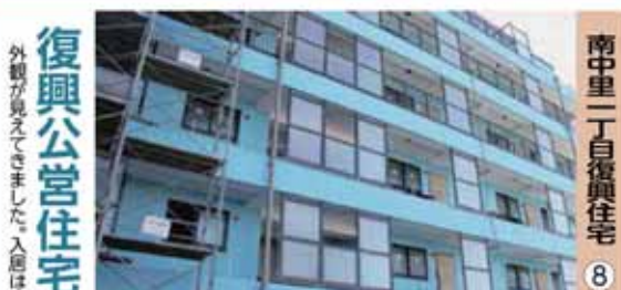
南中里一丁目復興住宅 ⑧