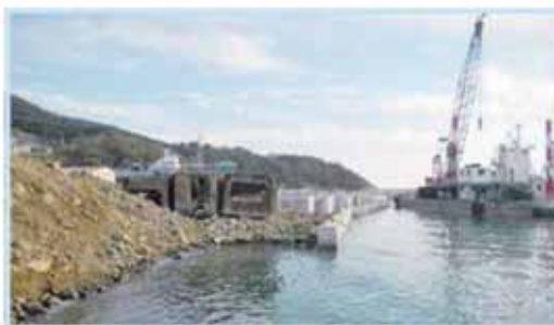
鮎川漁港岸壁復旧工事 ⑤