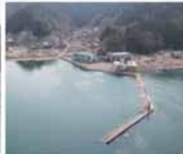
▲沈下した防波堤(平成23年3月撮影)