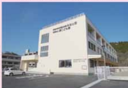
▲4月11日(土)移転新築を進めてきた複合施設の完成を祝い、落成式が行われました。施設は太陽光発電設備や災害用備蓄庫を備える遠地区の拠点遊園施設となります