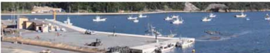
▲写真右側には、沈下した物揚場と防波堤が見えます。