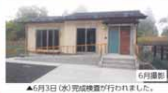
▲6月3日(水)完成検査が行われました。