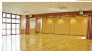
▲197平方メートルの広い遊戯室があります