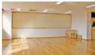
▲2階の子育て支援室は、園に通っていない地域の子どもの家庭でも、子育て相談や親子の交流の場として利用することができます