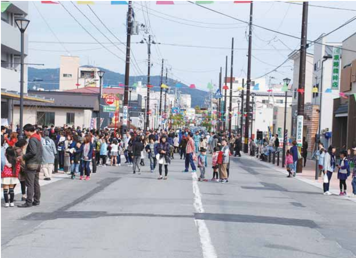
▲中央一丁目まちびらき(平成28年(2016)10月22日)