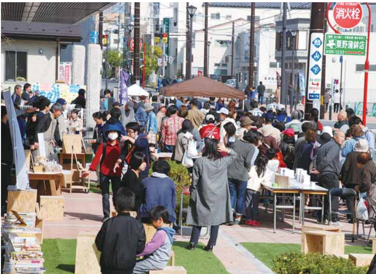
▲中央一丁目まちびらき(平成28年(2016)10月22日)