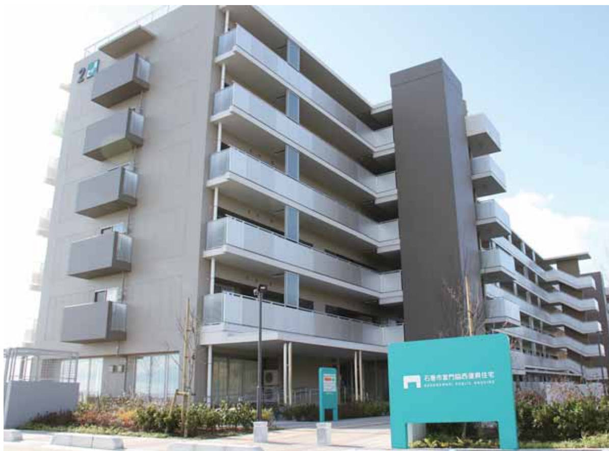
▲新門脇地区の復興公営住宅

なお、湊西(40.4ha)、上釜南部(37.4ha)、下釜南部(25.2ha)においては、産業系の土地区画整理事業が行われている。