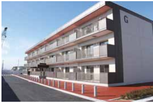
新蛇田復興公営住宅 ▶