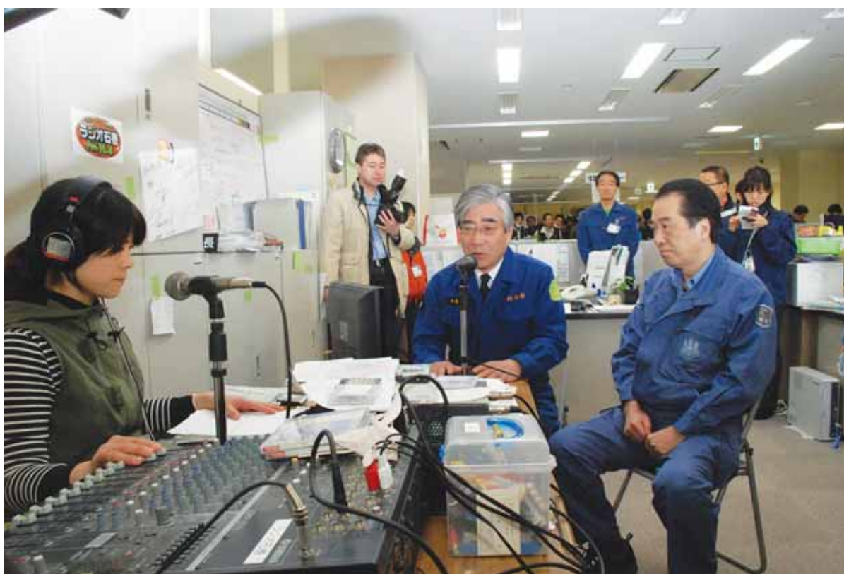
▲災害臨時エフエムに出演する菅総理と亀山市長