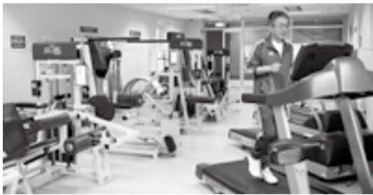
▲トレーニング室(河北総合センタービッグバン)

※各施設のトレーニング機器の使用を希望する方は、トレーニング使用講習を事前に受講してください。 ※対象は中学生以上ですが、中学生の方は、保護者同伴で受講してください。