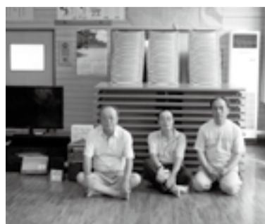
浜江場行政区(石巻地区)