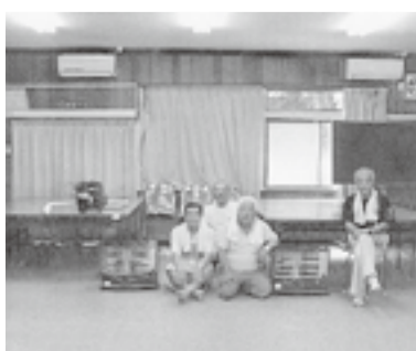
大瓜棚橋行政区(石巻地区)