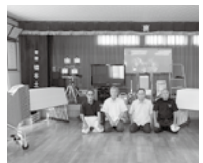
裏行政区(石巻地区)