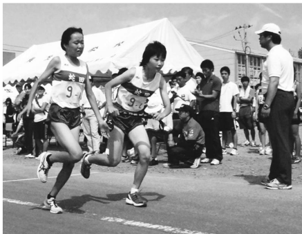
▲6連覇達成!! 蛇田中 女子チーム