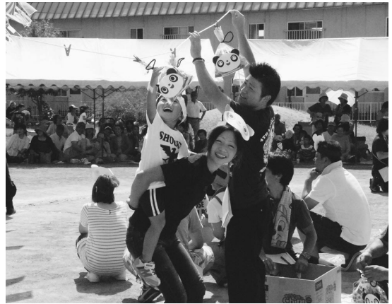
▲「ちびっこパンダのぼうけん」で親子をパチリ!

9月10日(土)、和瀬保育所で「わぶちキッズの運動会」が行われ、家族、地域の方々笑顔があふれていました。