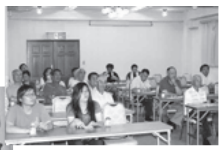
▲7月23日(金)の勉強会の様子

示すイベントを開催する予定です。今年度は、まち中見所のほか会員店のお宝などを掲載した「まちの散策マップ」の完成を目標に、現在も奮闘中です。