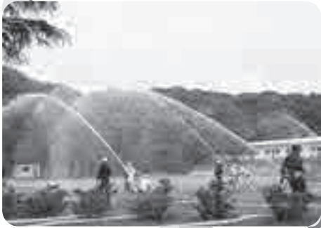
▲河南地区 北村小学校