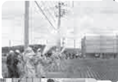
▲河北地区 大谷地小学校