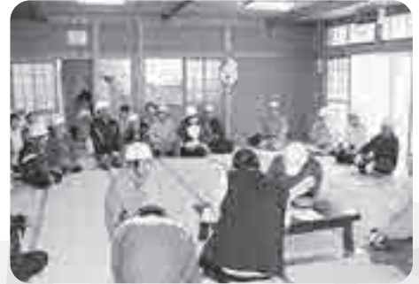
▲雄勝地区 波板老人憩の家